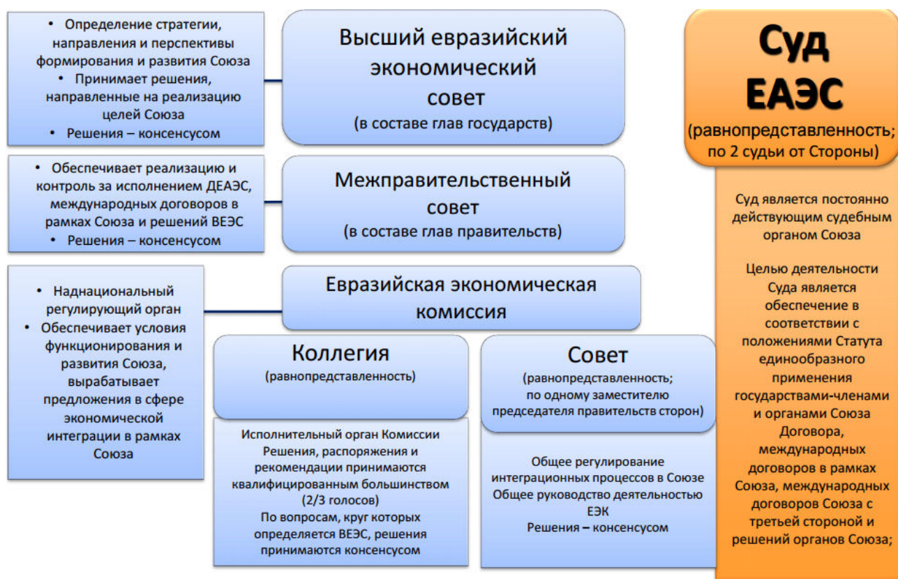
Рис.1. Структура органов ЕАЭС.