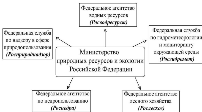
Рис. 1. Подведомственные службы Минприроды России.

В Российской Федерации государственное управление в области охраны окружающей среды, природопользования и обеспечения экологической безопасности находится в компетенции Министерства природных ресурсов и экологии Российской Федерации (Минприроды России). Подведомственные службы данного Министерства отображены на рис. 1.