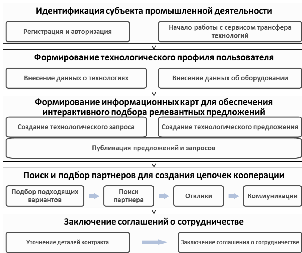
Рис. 2. Сводный бизнес-процесс трансфера технологий на базе государственной цифровой платформы верхнего уровня.