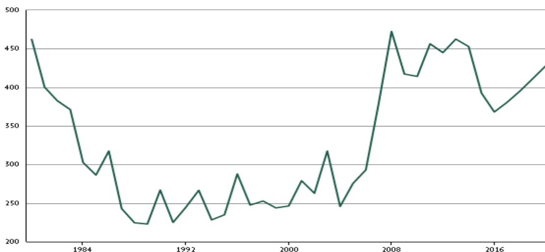
Рис.1. Динамики ВВП на душу населения Республики Мадагаскар в 1984-2018 гг., долл.

Если говорить о динамике подушевых доходов в рассматриваемый период, то она представлена на рис. 1.