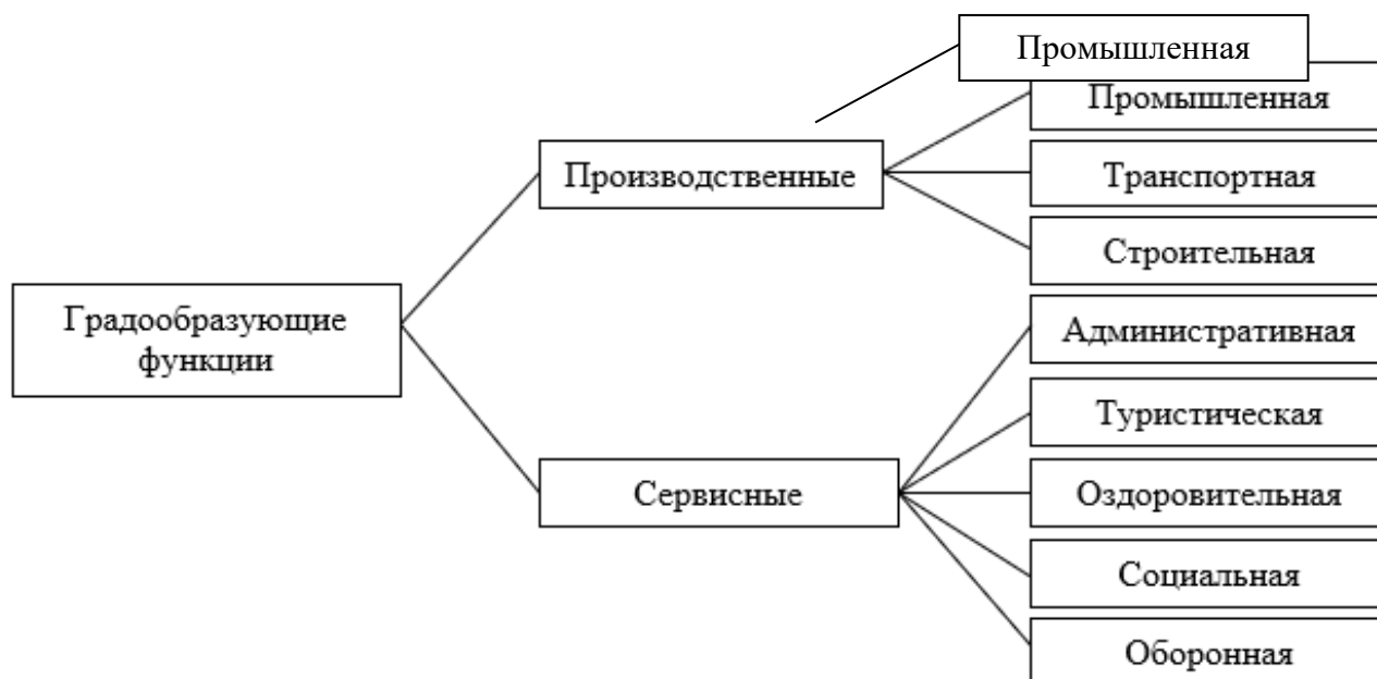
Рис. 2. Классификация градообразующих функций.