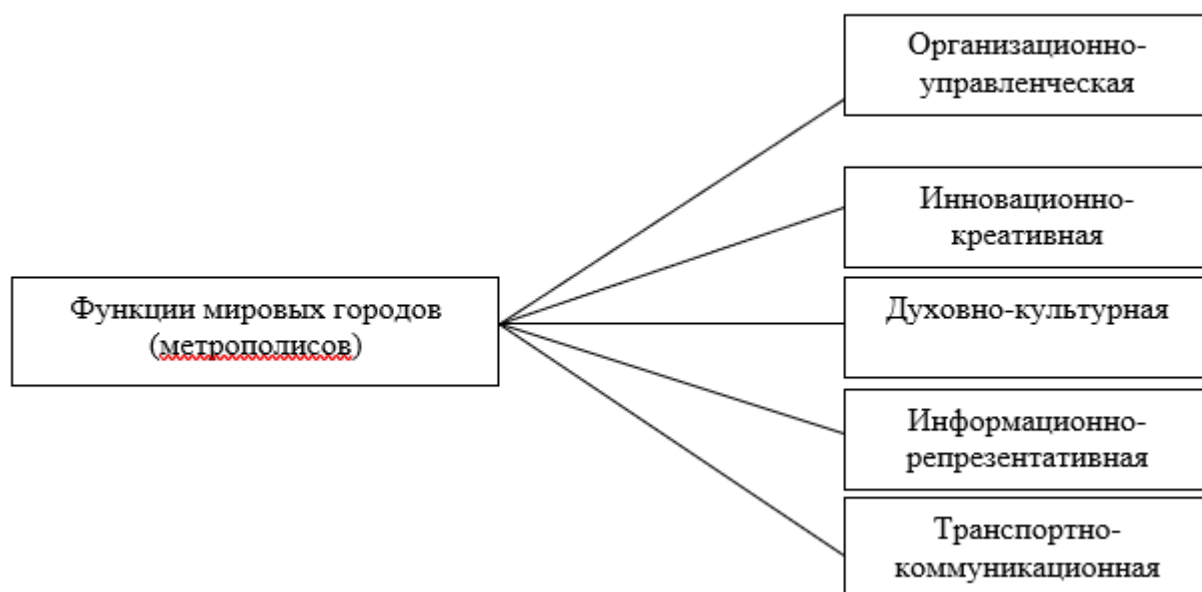
Рис. 3. Классификация функций мировых городов (метрополисов).

доминирующей функции и отсутствие преемственности функций чаще всего приводят к стагнации и даже упадку города.