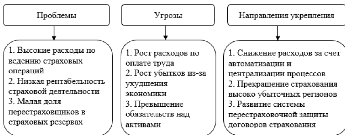
Рис. 1. Потенциальные угрозы и направления по их нейтрализации.