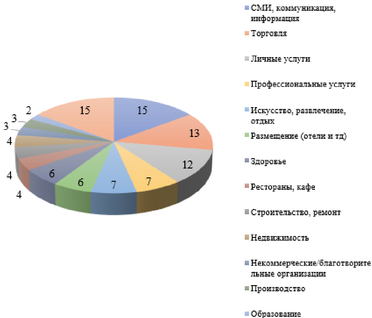
Рис. 3. Основные отрасли МСП во Франции (%), апрель 2018 г.