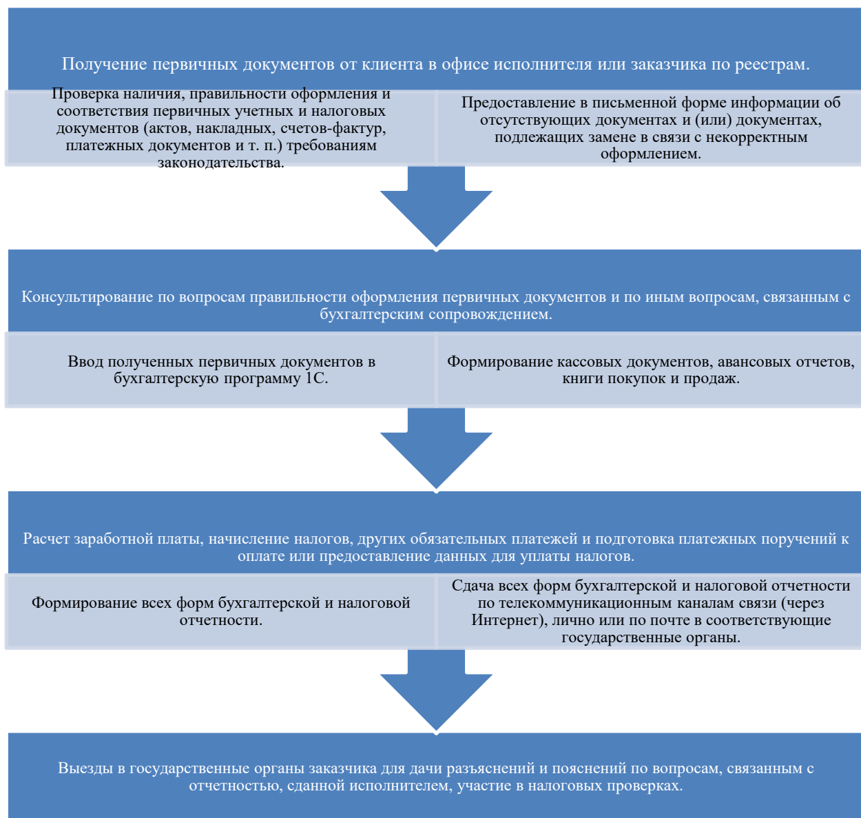
Рис. 2. Схема оказания услуг.