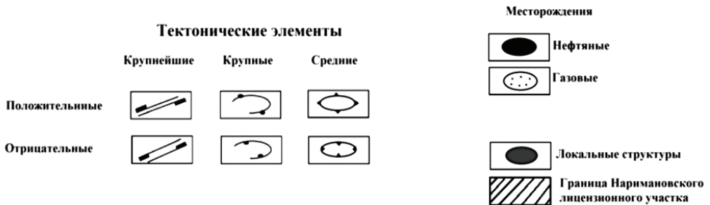
Рис. 1. Тектоническая схема Астраханско-Калмыцкого Прикаспия