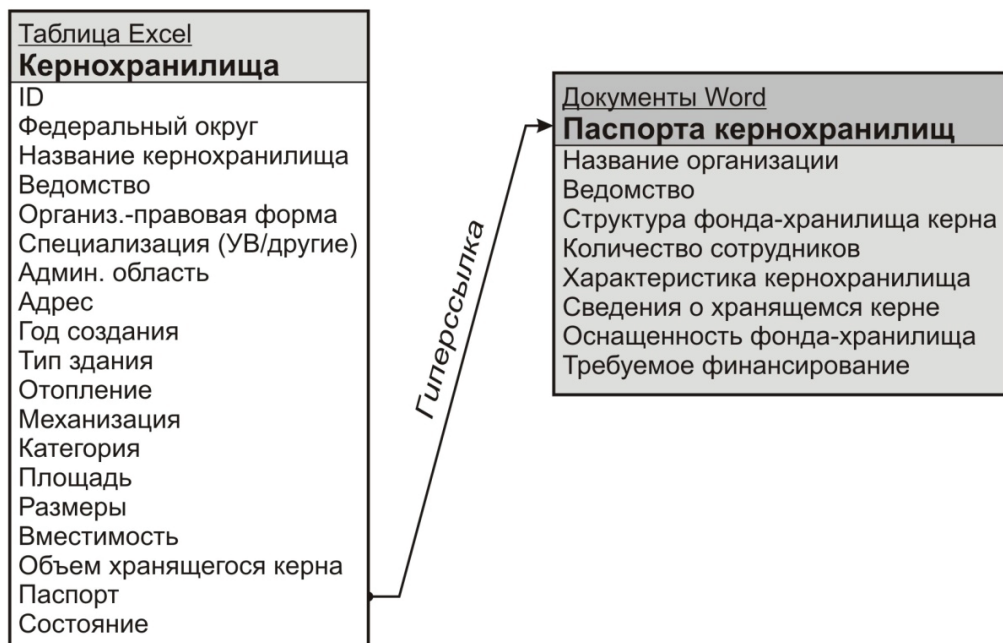
Рис. 3. Структура БД «Кернохранилища России» (форматы MS Excel, Word)

В Базе данных «Кернохранилища России» собраны сведения по 344 кернохранилищам различной специализации (углеводороды, другие полезные ископаемые) и ведомственного подчинения, а также принадлежащим негосударственным предприятиям. База данных представляет собой таблицу в файле Excel и папку с паспортами кернохранилищ в формате документов Word, которые открываются посредством гиперссылок из основной таблицы (рис. 3).