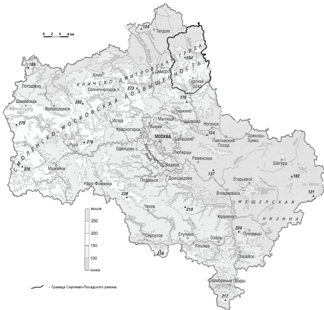
Рис. 1. Схема расположения района исследований

Большое значение изучение условий загрязнения родниковых вод приобретает в Сергиево-Посадском районе, где благодаря наличию двух резко различных типов рельефа широко распространены естественные выходы подземных вод на поверхность (рис. 1).