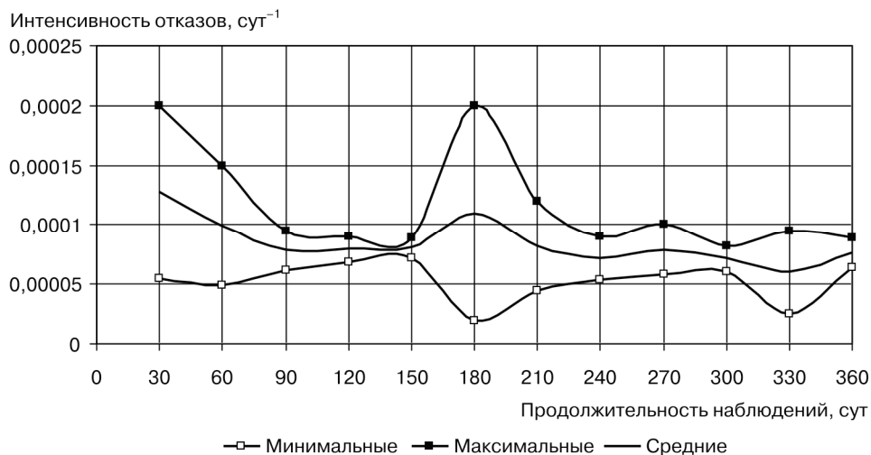
Рис. 1. Распределение интенсивностей отказов поплавковых клапанов

Событие, заключающееся в нарушении работоспособности арматуры, называется отказом. Критерии надежности раскрываются через систему формальных и объективных показателей, характеризующих ее нормативную работоспособность в режиме активного использования потребителями водопроводной воды. Количественное определение показателей надежности санитарно-технической арматуры выполнено на основе экспоненциального закона распределения данных о неисправностях того или иного типа. При этом формулировка отказа санитарно-технической арматуры заключается в следующем: P(t) > 0,7 . Снижение вероятности безотказной работы арматуры считать ее отказом. Изменение вероятности безотказной работы поплавковых клапанов представлено на рис. 2.