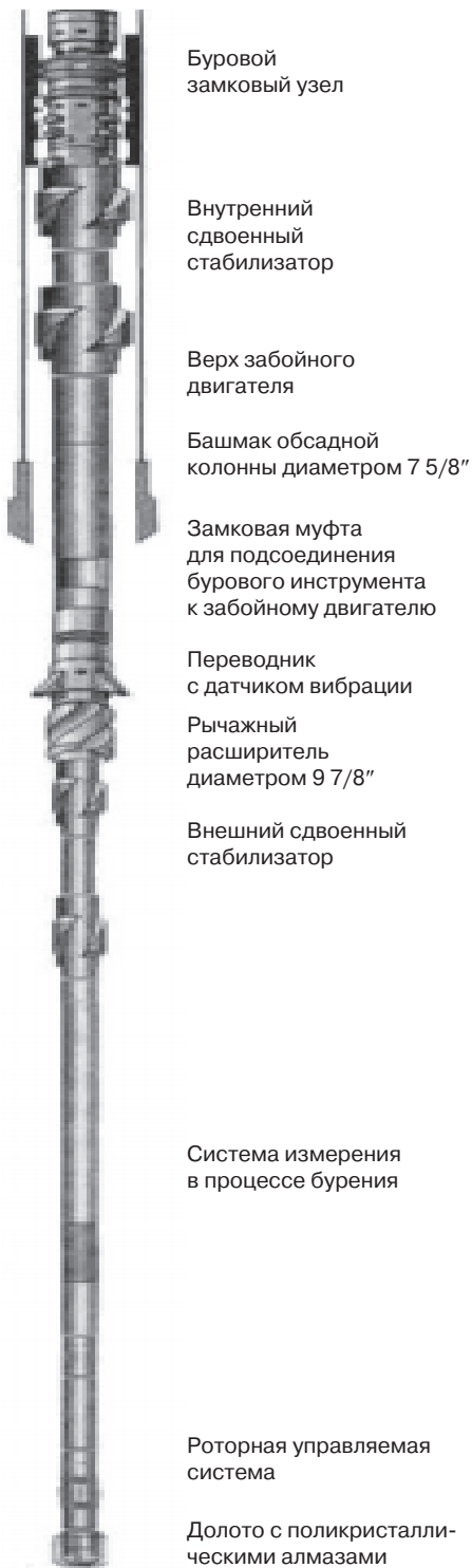
Рис. 1. Забойная компоновка для наклонно направленного бурения на обсадных трубах [Fig. 1. Bottom-hole assembly for directional casing drilling]

мощные эпигенетические толщи, повсеместно перекрытые сильнольдистыми сингенетическими отложениями [3].