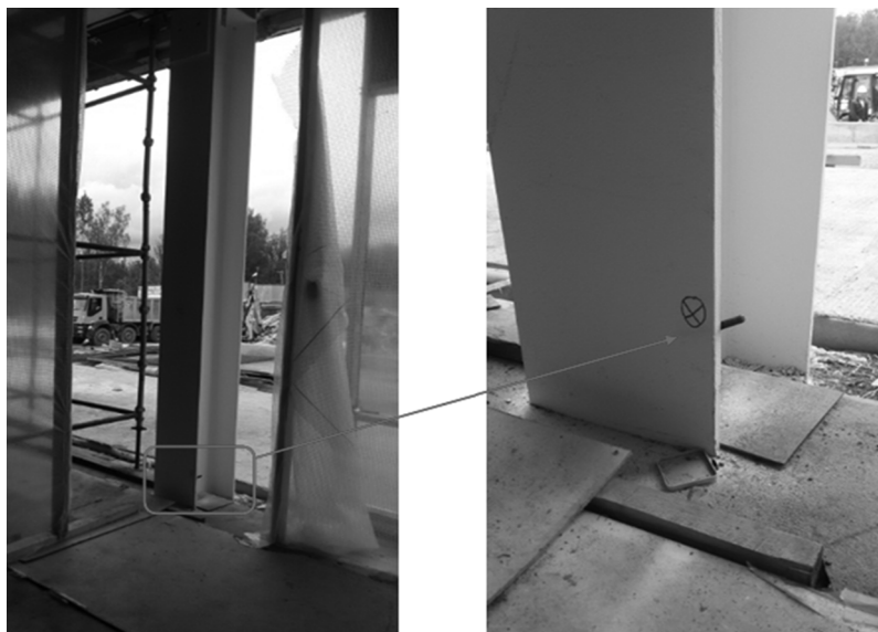
Рис. 2. Общий вид деформационной марки на несущей стальной колонне [General view of the deformation of the brand on the supporting steel column]

ность измерения осадок деформационных марок: погрешность определения осадок должна быть не более m_{\Delta} = 1,0 мм. Осадки деформационных марок определяются как разность высот марок текущего и нулевого (начального) цикла геодезических измерений, а также как разность высот марок в соседних циклах измерений. Для достижения требуемой точности измерения осадок необходимо предварительно рассчитать требуемую точность геодезических измерений.