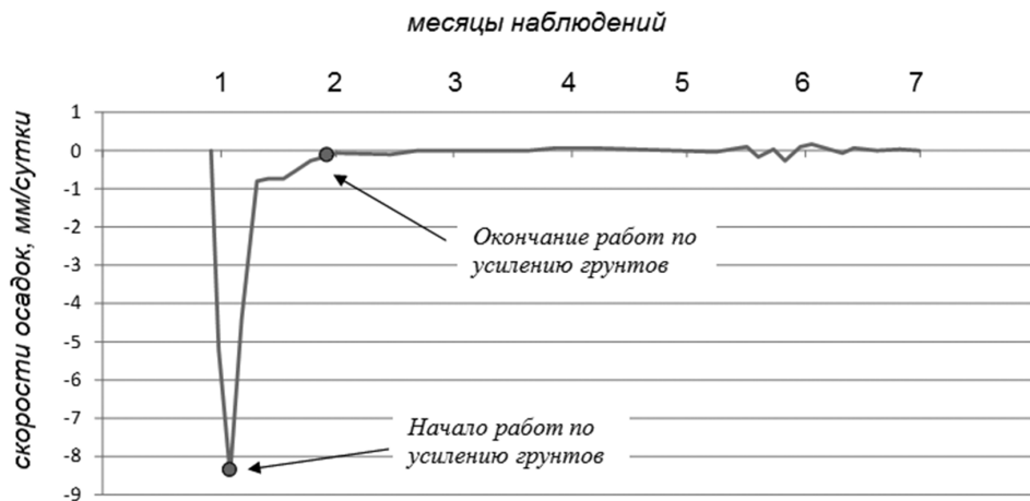
Рис. 5. Скорости осадков деформационных марок [Speed sediment deformation signs]

В результате проведенных работ по укреплению грунтов дальнейшее развитие деформационных процессов было приостановлено и в течение одного месяца осадки здания были стабилизированы. Данные последующего геодезического мониторинга в течение 6 месяцев подтвердили эффективность выполненных работ по укреплению грунтов и усилению фундаментов здания.