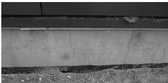
Рис. 1. Трещины в фундаментной балке раскрытием до 10 мм [Cracks in the foundation beam opening up to 10 mm]

Конструктивно здание представляет собой каркасную рамно-связевую схему. Каркас здания образован плоскими многопролетными двухэтажными рамами, установленными по цифровым осям с шагом 12 м. Фундаменты колонн мелкого заложения, столбчатые отдельностоящие, одноступенчатые. Наружные ограждающие конструкции опираются на монолитные ж/б фундаментные балки. Габаритные размеры здания в плане 24 × 107,5 м. Согласно нормативной документации здание относится ко II нормальному уровню ответственности.