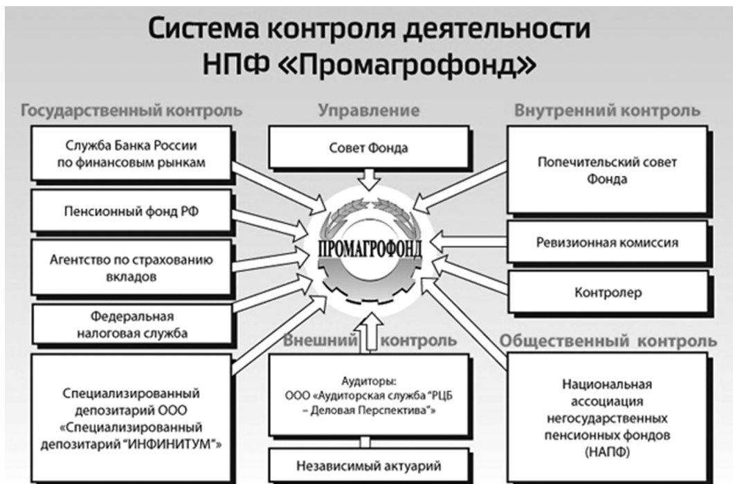
Рис. 1. Система контроля деятельности НПФ «Промагрофонд»

На рисунке 1 показан также внешний контроль . Законом РФ «О негосударственных пенсионных фондах» установлена обязанность каждого фонда ежегодно проходить проверку у независимого аудитора и независимого актуария. Последний проводит актуарное оценивание фонда, цель которого — дать ответ на вопрос, выполнимы ли обязательства фонда перед его участниками. Заключение независимого аудитора и актуария являются неотъемлемой частью годового отчета фонда в ФСФР.