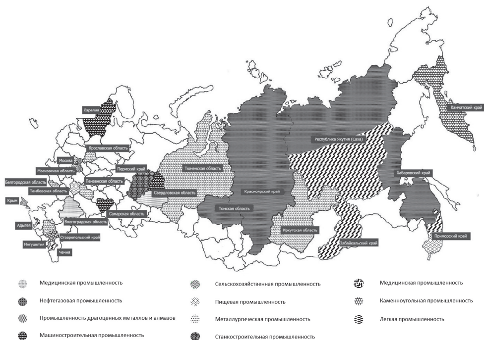
Рис. 2. Крупнейшие сделки индийских предпринимателей на российском рынке (2000–2019) [Figure 2. The biggest deals involving the Indian capital in Russia (2000–2019)]