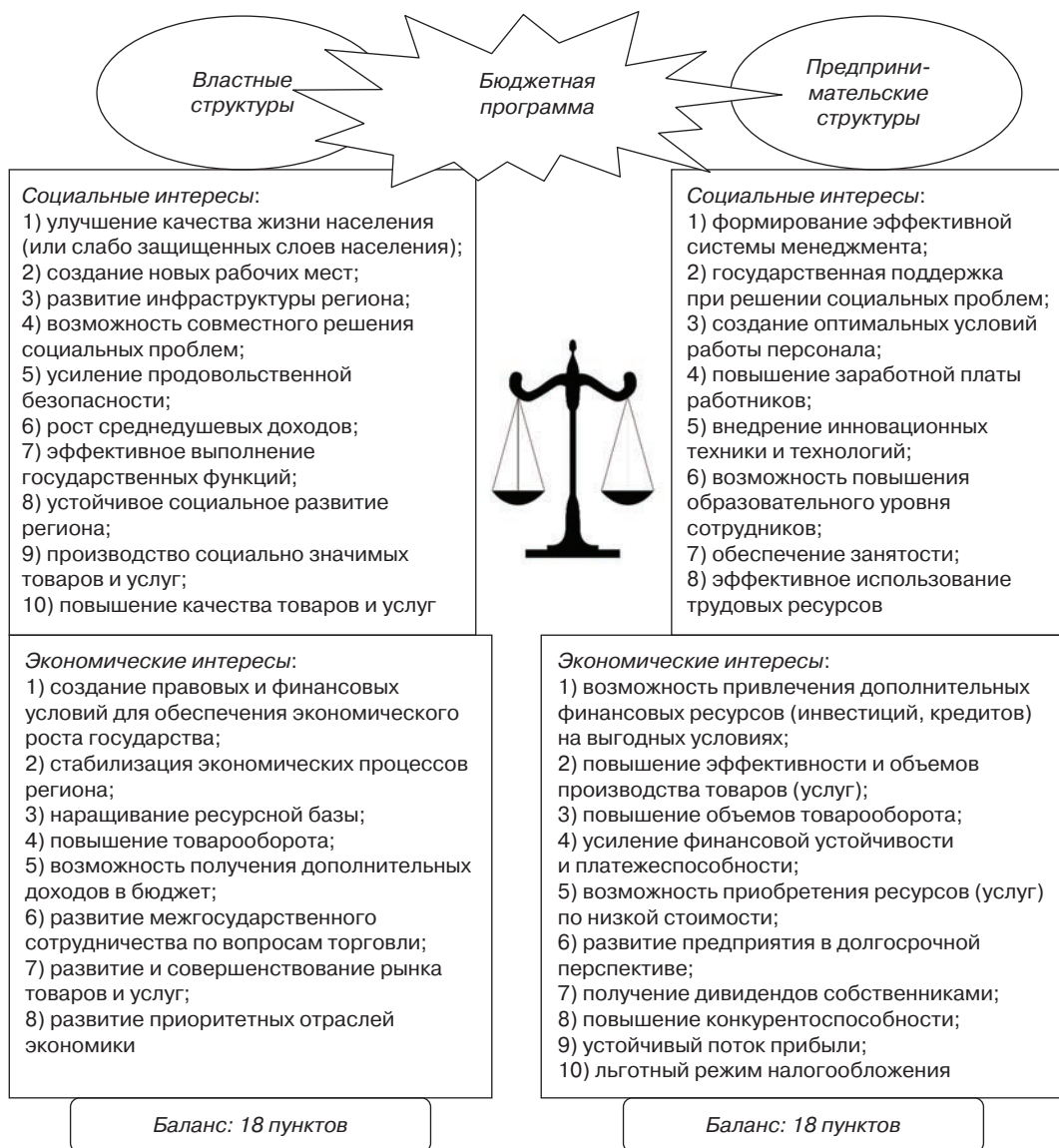
Рис. 3. Баланс социально-экономических интересов властных и предпринимательских структур (на примере развития торговли в рамках Нового Шелкового Пути)

новых рабочих мест, суммы компенсации единого социального взноса, ставку льготного налогообложения и др. Взаимные выгоды могут сравниваться экспертами с обеих сторон, а также независимыми специалистами, привлекая их для объективного анализа баланса интересов.