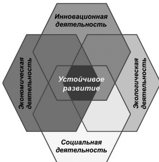
Рис. 3. Усовершенствованная концепция устойчивого развития [Fig. 3. Advanced concept of sustainable development]

авторская точка зрения на понимание «устойчивого развития» дополняет общепризнанную схему еще одной составляющей — инновационной (рис. 3).