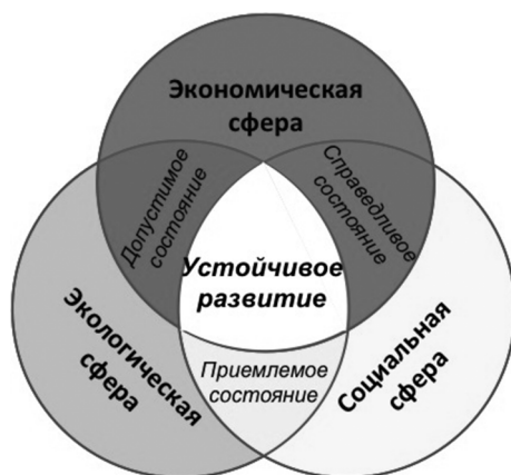
Рис. 1. Элементы концепции устойчивого развития [Fig. 1. Elements of the concept of sustainable development]

В процессе своей эволюции модели устойчивого развития прошли путь от модели «Микки Маус» с приоритетом экономики, «сильной» модели или модели «бычий глаз» с приоритетом экологии до «слабой» модели с приоритетом баланса (рис. 2).