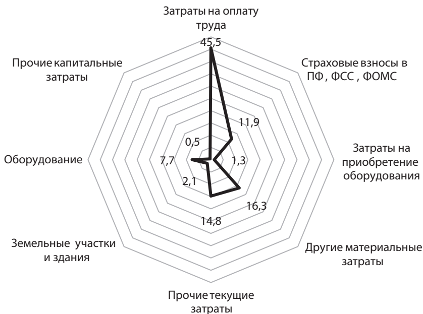
Рис. 3. Удельный вес внутренних затрат на исследования и разработки по видам затрат в 2014 г., % [17]

Основным направлением внутренних затрат на исследования и разработки промышленных предприятий Пермского края остаются текущие затраты — затраты на оплату труда, доля которых колеблется в пределах 40—46%, и другие материальные затраты, к которым относится стоимость приобретаемого сырья, материалов, комплектующих изделий, полуфабрикатов, топлива, энергии, работ и услуг производственного характера. Доля последних в общем объеме внутренних затрат исследования и разработки колеблется от 16 до 32%. Нужно отметить, что данные направления внутренних затрат на исследования и разработки имеют противоположную динамику с 2011 г.