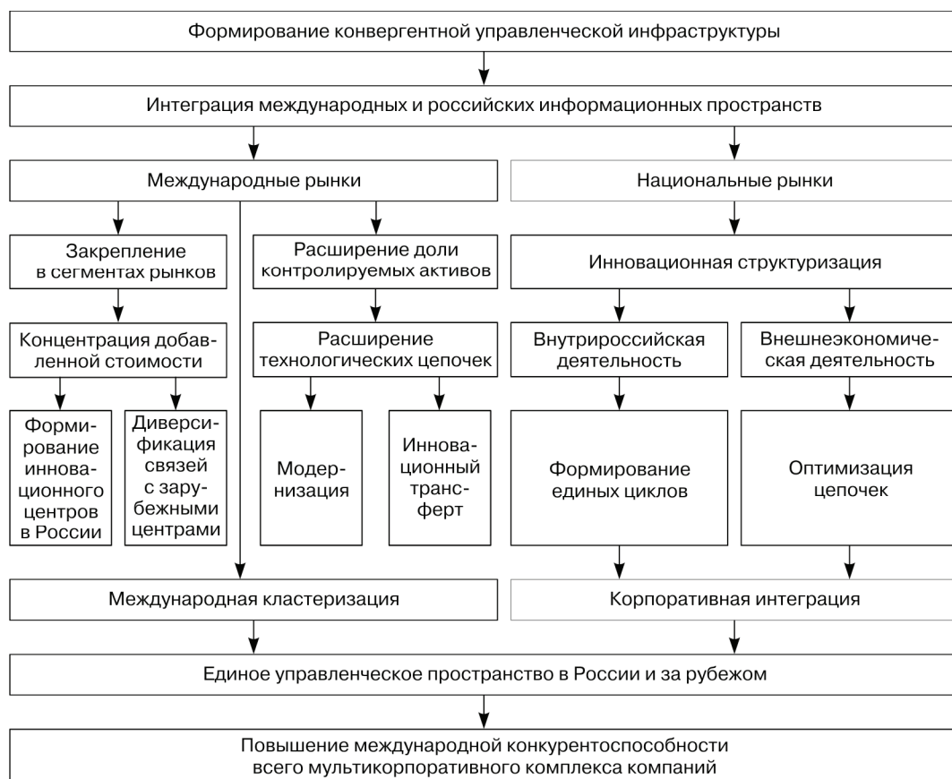
Рис. 2. Структура процесса инновационной стратификации российских компаний и их зарубежных структур

Общий процесс инновационной стратификации российских компаний и их зарубежных структур имеет направленность: формирование конвергентной управленческой инфраструктуры → повышение международной конкурентоспособности всего мультикорпоративного комплекса российских компаний (рис. 2).