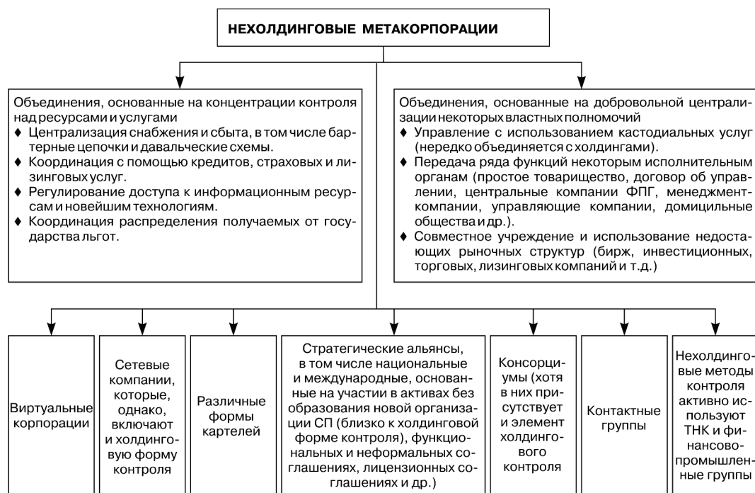
Рис. 3. Классификация нехолдинговых метакорпораций