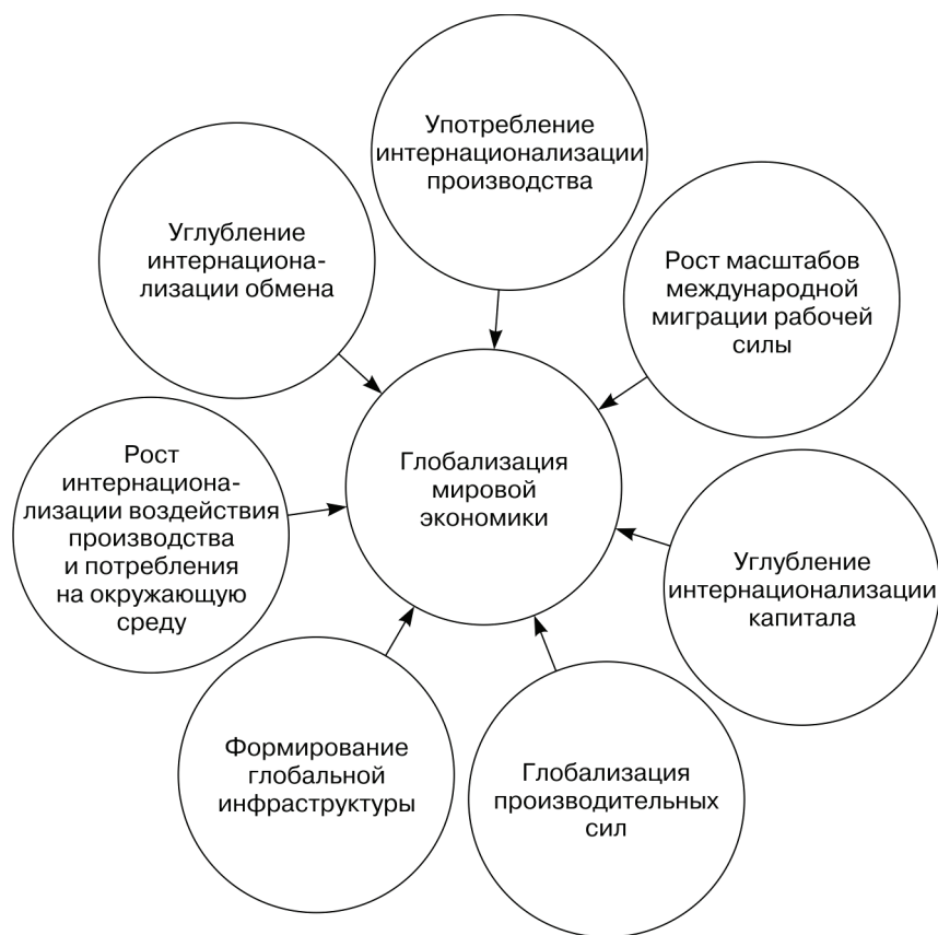
Рис. 1. Основные сегменты глобализации мировой экономики