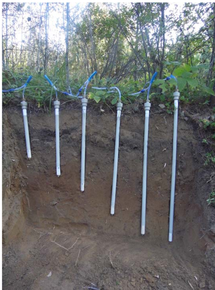
Рис. 1. Вид расположения лизиметров в глубине почвенного профиля / Figure 1. View of the location of lysimeters in the depth of the soil profile

Элементный химический состав растений и почв определялся методами пламенной фотометрии, атомно-абсорбционной спектрофотометрии, фотоколориметрирования с использованием приборного парка Байкальского аналитического центра (ЦКП) ИНЦ СО РАН по сертифицированным методикам, в частности AAS Vario 6 (Analytik Jena AG, Германия), спектрофотометр Spectrum One FT-IR, (PerkinElmer Life and Analytical Sciences, США), Agilent 6890/5973 GC/MSD System (Agilent Technologies, США). Полученный массив данных подвергался статистическому и корреляционному анализу («Среда статистических вычислений R» и ее использование в Data Mining).