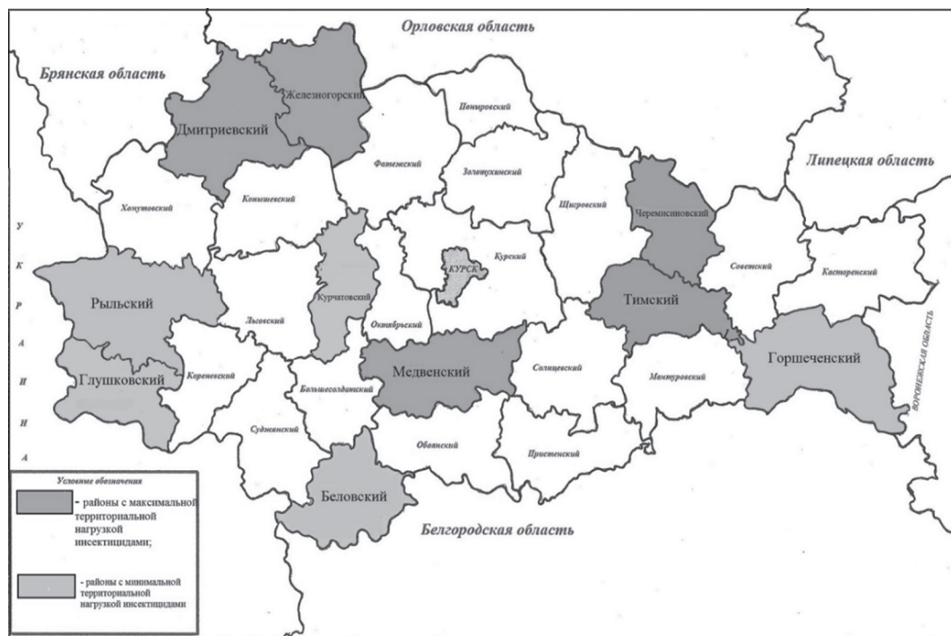
Рис. 2. Ранжирование районов Курской области по территориальной нагрузке инсектицидов (Ranking of the Kursk region in the territorial load insecticides)