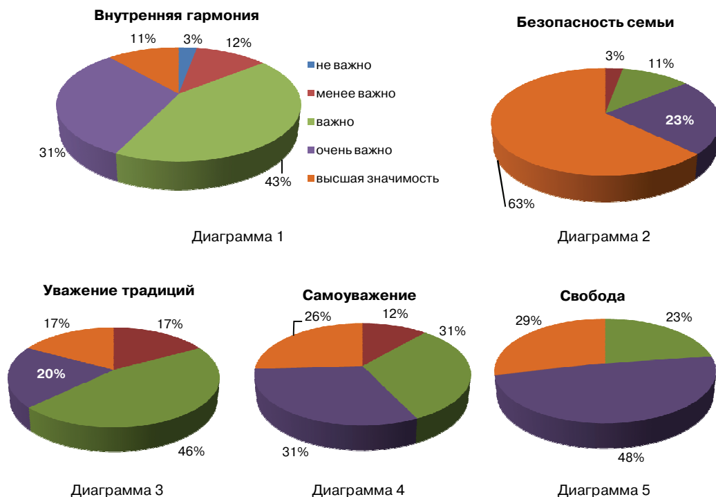
Рис. 1. Анализ уровня личностных ценностных ориентаций у иногородних студентов

Результаты и их обсуждение. По итогам проведенного тестирования выделены наиболее значимые, на наш взгляд, жизненные ценности, по которым проведен анализ уровня личностных ценностных ориентаций у региональных студентов (рис. 1).