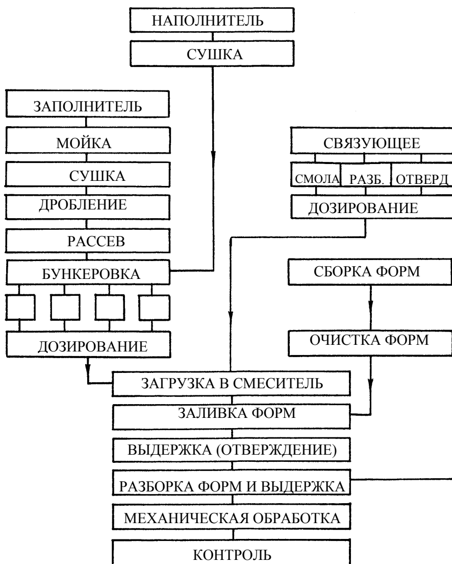
Рис. 2. Схема технологического процесса

53%. В комплексе с относительно низкой стоимостью синтеграта по сравнению с аналогами применение таких панелей позволяет существенно снизить прямые затраты на устройство вентилируемых фасадов.