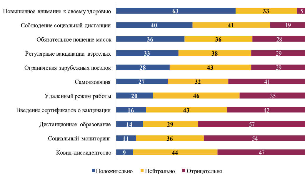
Рис. 3. Как россияне относятся к новому, появившемуся в условиях пандемии, что, возможно, сохранится в будущем, март 2021 года, %

внимание к своему здоровью, соблюдение социальной дистанции (4), обязательное ношение масок и регулярные вакцинации. Безусловно, откровенно, что две трети россиян заявляют о повышенном внимании к своему здоровью. Однако анализ данных о распространенности самосохранительных практик показывает, что, с одной стороны, в период пандемии многие носили маски и сократили количество контактов, но, с другой стороны, не считают нужным делать частью повседневной жизни занятия физкультурой и спортом, здоровое питание и другие самосохранительные практики, способные долгие годы поддерживать здоровье в хорошем состоянии. Таким образом, распространенное реактивное отношение российского населения к своему здоровью, при котором заботиться о нем начинают только после его ухудшения, при наличии проблем в системе отечественного здравоохранения и отсутствии достаточных средств на платную медицинскую помощь, ставит под сомнение реализацию программы активного долголетия и в перспективе окажется дополнительным вызовом для рынка труда, пенсионной системы и медицины.