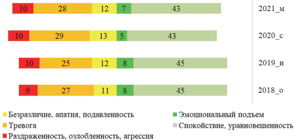
Рис. 2. Динамика оценок россиянами личного социально-психологического состояния, 2018–2021 годы, %