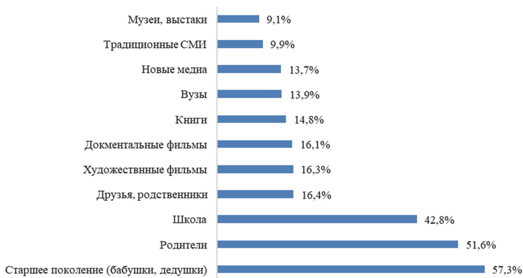
Рис 1. Основные источники информации о советском прошлом и прошлом страны

Семейный нарратив о прошлом, как правило, носит локальный характер, не в полной мере отражает реалии Советского Союза, искажает событийный ряд исторических фактов. Следует также иметь в виду возрастные рамки исследования: респонденты изучали изменяющееся содержание исторического дискурса, в котором после 1990 года усиливалось отрицание советского опыта, а интерпретация исторических событий все в большей мере была связана с обоснованием нового политического порядка и права на суверенитет, независимость, что подтверждается различиями представлений респондентов о СССР по возрастным группам (Рис. 2). Однако это не дает оснований говорить, что именно первые три источника являются основными регуляторами памяти поколения Y. Согласно Таблице 1, характер информации, степень доверия к ней и ее принятие не однозначны, что свидетельствует о критическом восприятии молодыми коммуникативной и культурной составляющих памяти. Позитивная репрезентация прошлого старшим поколением, музеями, выставками, мемориальными комплексами (более 70%), другими каналами (50%–60%), впрочем, как и негативная, может нивелироваться особенностями личностного восприятия, интерпретацией событий прошлого как символического ресурса, доступной информацией, включенностью в конкретные среды и последствиями регулирования воспоминаний о прошлом. Кроме того, информация, транслируемая всеми каналами, у 40% респондентов не прошла верификацию личным опытом.