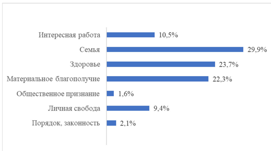
Рис. 2. «Какие жизненные ценности имеют для Вас сегодня наибольшее значение?» (в %)

мероприятиях университета». «Несмотря на то, что молодые люди пытаются вести здоровый образ жизни, достаточно много молодежи имеют вредные привычки, такие как курение, употребление алкоголя, наркотиков. Особенно это распространено в подростковой среде. В связи с этим молодое поколение не отличается хорошим здоровьем». «Я не могу оценивать состояние здоровья всей молодежи. Но могу сказать, что молодые люди и спортом занимаются, и имеют вредные привычки». С одной стороны, многие молодые люди стремятся к здоровому образу жизни, он входит в моду. С другой стороны, наркотики, психотропные вещества распространяются в основном среди молодежи.