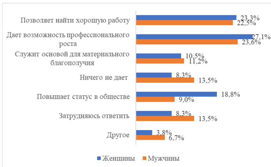
Рис. 1. «Как Вы считаете, какую роль в жизни человека играет высшее образование?» (в %)

карьеру, чем мужчинам — несмотря на декларируемое гендерное равенство, в профессиональной сфере сохраняются скрытые ограничения для женщин. Социокультурные нормы и гендерные стереотипы фиксируют разницу в социальных ролях как в трудовой сфере, так и за ее пределами.