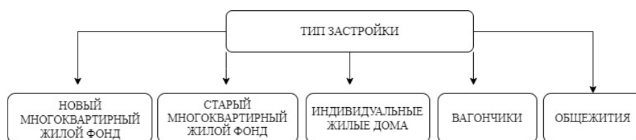
Рис. 2. Классификация типов проживания мигрантов по основанию «тип застройки»

Типы застройки, в которых проживают информанты, мы разделили на новый и старый многоквартирный жилой фонд, индивидуальные жилые дома, строительные вагончики и общежития (Рис. 2). Новый многоквартирный жилой фонд — это все дома, построенные после распада СССР, старый жилой фонд — построенные ранее. Проживающие в домах нового жилого фонда могут иметь квартиру в собственности, как, например, таксист А. (м., 48 лет, таджик), снимать квартиру, как владелец парикмахерской И. (м., 35 лет, азербайджанец), комнату, как работница рынка Н. (ж., 45 лет, узбечка) или койко-место, как Ш. (м., 25 лет, таджик). Квартиры нового жилого фонда и приобретенные информантами часто располагаются за МКАДом по причине более низкой стоимости и расположения работы. Собственник А., который купил трехкомнатную квартиру в Люберцах на стадии котлована, хотел бы жить поближе к МКАДу, но не было подходящих по сумме и площади вариантов. Собственников А. и С. эта локация устраивала без оговорок, поскольку они работают за МКАДом. Среди информантов не было тех, кто имел квартиру в собственности в старом жилом фонде — здесь снимают квартиры, комнаты и койко-места. Мы столкнулись с переизбытком информантов, которые арендуют койко-места в пределах МКАДа в квартирах старого жилого фонда, и заметили тенденцию, что в пределах МКАДа мигранты чаще живут в квартирах старого жилого фонда, за пределами — нового. Насколько это верно — будем проверять в дальнейших исследованиях.