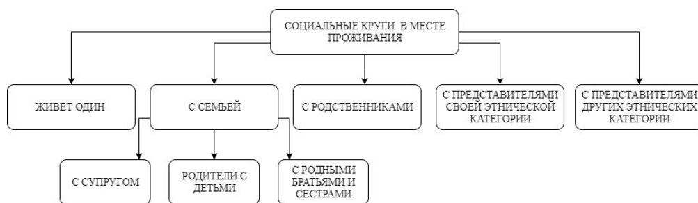
Рис. 3. Классификация типов проживания мигрантов по основанию «социальные круги в месте проживания»

Следующим основанием классификации стали характеристики социальных кругов в месте проживания — были выделены проживание в одиночку, с семьей, с родственниками, с представителями своей этнической категории (не семья или родственники), с представителями других этнических категорий