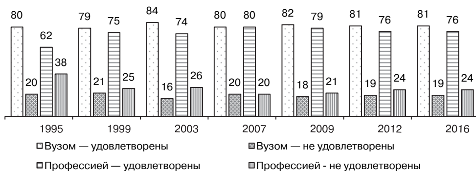
Рис. 2. Динамика показателей удовлетворенности студентов вузом и профессией, %

Даже с учетом того, что респонденты два-три года назад на себе ощутили реальную доступность образования, их ответы весьма показательны. С одной стороны, преобладает мнение: в нашем регионе качественное высшее образование доступно (особенно в этом уверены «естественники»), и эти оценки совпадают с общефедеральными. Свердловская область среди российских регионов по числу доступных мест находится на 22 позиции, по территориальной доступности вузов — на 17—19, по финансовой доступности — на 24, а по числу качественных («высокоселективных») мест — на 3, уступая только Санкт-Петербургу (1 позиция), Томску (2) и обогнав Москву (4) [6. С. 13]. С другой стороны, распространено и мнение о значительных различиях качества образования между вузами (чаще такое мнение высказывают «экономисты»).