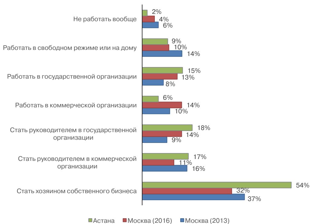
Рис. 2. «В будущем ты надеешься...»

Каждый третий российский респондент (и каждый второй казахстанский) хотел бы в будущем стать хозяином собственного бизнеса (рис. 2). Подобный разрыв, видимо, можно объяснить широко обсуждаемыми сложностями мелкого и среднего предпринимательства в России. Вероятно, с ними же связано наметившееся в российском опросе предпочтение государственных организаций для занятия руководящих должностей (доли ориентированных на эту группу должностей в коммерческом и государственном секторах в казахстанском опросе выше — 17% и 18%). Казахстанские респонденты реже хотят работать в коммерческом секторе (6% против 15% заинтересованных в трудоустройстве на государственные предприятия и 14% в российской выборке) и реже допускают возможность не работать вообще (1,8% против 4,4% в московской выборке). Несмотря на, казалось бы, популярность фриланса, работать в свободном режиме или на дому готов лишь каждый десятый, а среди московских респондентов эта доля за три года снизилась (с 14,3% до 9,6%).