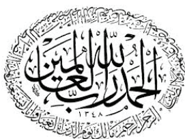
Рис. 2. Арабская каллиграфия [2]

Своеобразие и величие арабской культуры демонстрирует орнаментальная арабская вязь, передавая неповторяемый колорит Востока и, как правило, содержащая выдержки из Корана и других традиционных источников: