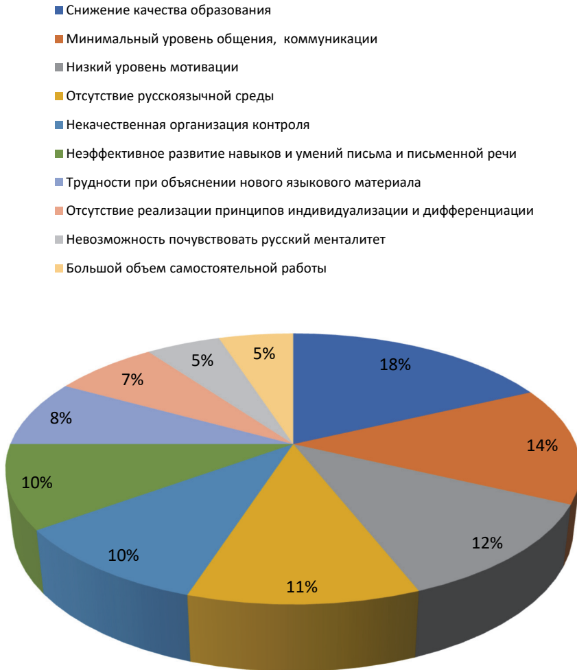
Рис. 2. Минусы онлайн-обучения РКИ

Если онлайн-форма организации учебного процесса стала актуальной в период пандемии, то, возможно, она займет свою нишу в образовательном процессе как одна из возможных и даже единственно доступных в сложных социальных ситуациях. Для ответа на этот вопрос следует вспомнить слова известного греческого философа Аристотеля: «Обучая учусь». В настоящее время обучаться приходится как студентам, так и преподавателям в непростых образовательных условиях.