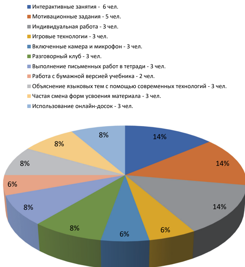
Рис. 3. Предложения по улучшению организации и проведению онлайн-обучения РКИ