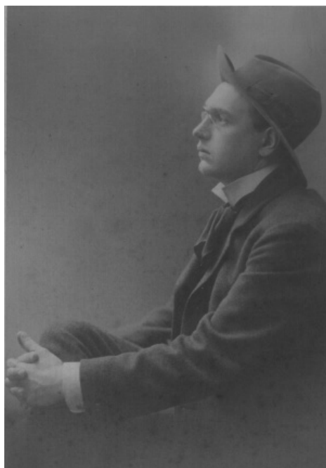
Алексей Александрович Рыбников. Фото. 1910-е гг. 1

Исследование проблемы. Художник Алексей Александрович Рыбников (1887–1949), более известный как художник-реставратор, стоял у истоков советского музейного строительства. Став в годы революции и Гражданской войны сотрудником Отдела по делам музеев и охране памятников искусства и старины Народного комиссариата просвещения, он все эти тяжелые годы активно занимался вопросами сохранения историко-культурного наследия, спасал художественные богатства страны. Поступив в 1919 г. на работу в национализированную к тому времени Государственную Третьяковскую галерею, он возглавил только что созданный реставрационный отдел и отдал спасению и реставрации живописи 30 лет своей жизни.