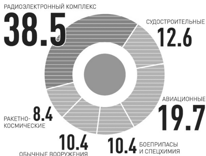
Рис. 2. Отраслевая структура предприятий ОПК, % [13]

Так сложилось, что результаты оборонных НИОКР использовались в гражданских отраслях. Такое взаимодействие должно обеспечить взаимный трансферт технологий. В ряде сфер (телекоммуникации, новые материалы) гражданские отрасли, по существу, являются основной движущей силой динамичного развития военной техники. В других, например в авиации, военные разработки дают толчок гражданским секторам. Элементами системы должны являться межотраслевые и отраслевые (региональные) центры сбора, хранения и распространения информации о созданных технологиях. Это позволит обеспечить единство учета и предоставления сведений о результатах выполнения НИОКР, повысить прозрачность и эффективность использования технологий. По мнению экспертов, обратной процедурой должно стать создание новых оборонных производств за счет средств частного бизнеса. Новые компании могут стать источником технологических прорывов. Целесообразно создать объединенный портал, информирующий о потребностях ОПК в привлечении новых технологий и инвестиций.