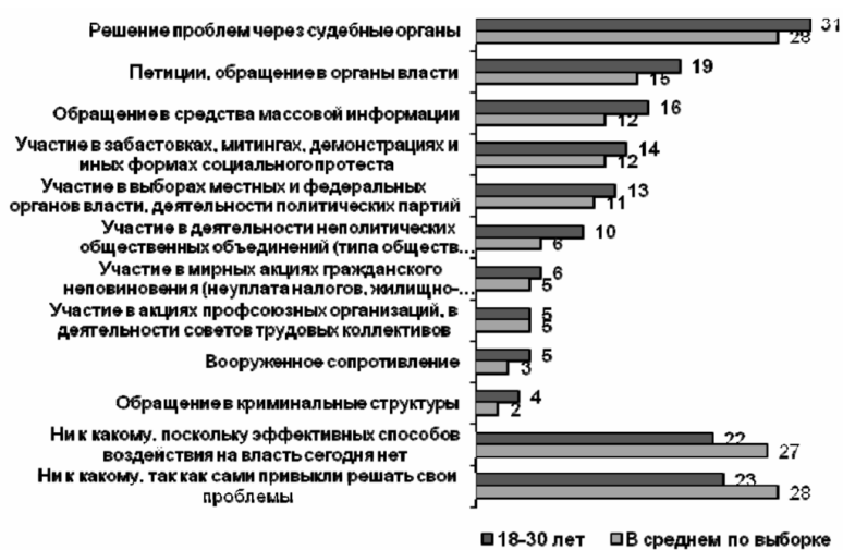
Рис. 2. Способы защиты прав в случае их ущемления (любое число вариантов ответа), %

Соотношение способов защиты прав у молодежи не отличается от такового среди населения в целом, тем не менее обращают на себя внимание следующие моменты. В частности, положительным моментом видится то, что молодежь отдает приоритет в решении своих проблем судебным инстанциям. В то же время молодежь, пусть и с небольшим перевесом по сравнению со средними показателями, готова включиться в вооруженное сопротивление (5%) и обратиться в криминальные структуры (4%) для защиты своих интересов.