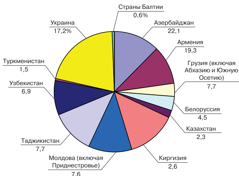
Рис. 2. Доля иностранных школьников из бывших советских республик, обучающихся в общеобразовательных учреждениях Москвы в 2014/15 уч. г., по странам происхождения (%)

Сегодня наиболее крупными национальными общинами в столичных школах (по странам происхождения) являются выходцы из Украины, Азербайджана, Молдовы (и главным образом — Приднестровья), Таджикистана, Киргизии и Узбекистана (рис. 2).