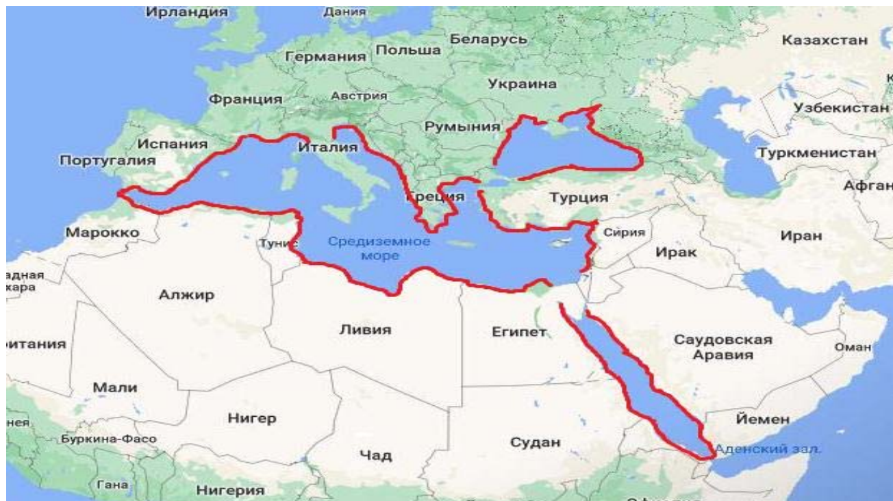
Рис. 1. Большое Средиземноморье в узком региональном масштабе

находящихся на берегу и в акватории трех морей — Средиземного, Красного и Черного, а также других небольших морей, расположенных между ними или по соседству, — Эгейского, Мраморного, Ионического, Азовского и т. д., то есть территорию Великобритании, Франции, Испании, Португалии, Марокко, Алжира, Туниса, Ливии, Египта, Судана, Эритреи, Джибути, Йемена, Саудовской Аравии, Иордании, Израиля, Палестины, Сирии, Ливана, Турции, Грузии, России, Украины, Молдовы, Румынии, Болгарии, Греции, стран бывшей Югославии, Италии, Сан-Марино, Ватикана, Монако, Кипра и Мальты. Учитывая географические и политические особенности, Пиренейский полуостров и территория бывшей Югославии, а также Молдова, Ватикан и Сан-Марино являются частью региона Большого Средиземноморья. Все события, происходящие в странах (в любой части страны), которые находятся на берегу этих трех морей, а также других небольших морей, расположенных между ними или по соседству, прямо касаются региона Большого