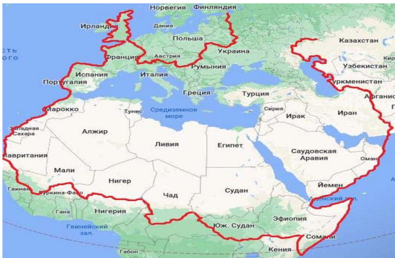
Рис. 3. Большое Средиземноморье в глобальном масштабе