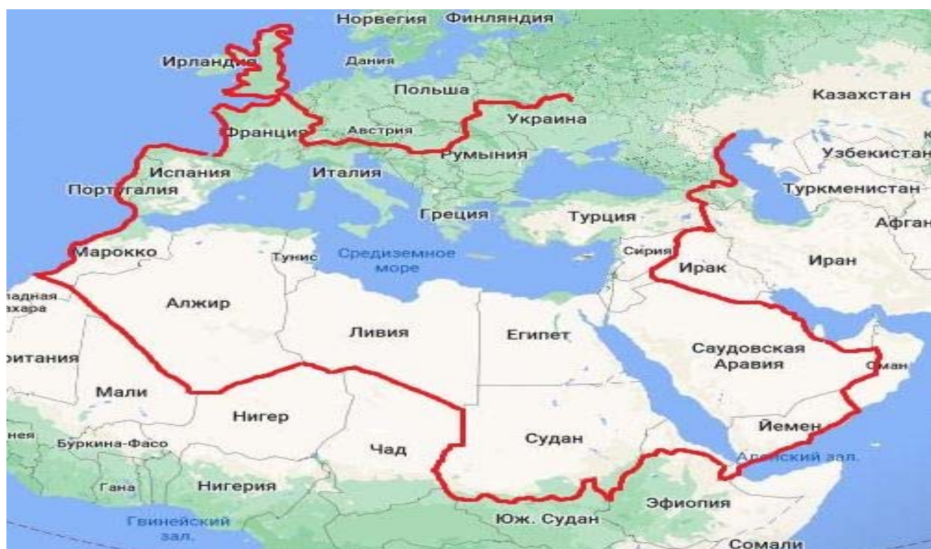
Рис. 2. Большое Средиземноморье в широком региональном масштабе

Исходя из этих классификаций, можно прийти к выводу, что на самом деле Большое Средиземноморье — не столько географическое, сколько военно-политическое определение. Например, Россию и Судан географически ничего не объединяет, они находятся в разных географических регионах, однако военно-политические события, происходящие в Судане, могут повлиять на позицию России