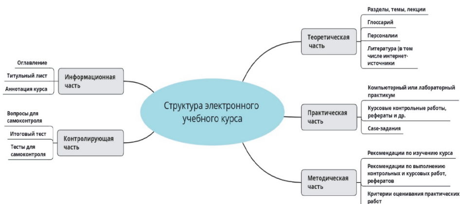
Рис. 2. Структура электронного учебного курса

На рис. 2 представлена структура учебного курса, содержащая минимальный необходимый набор структурных элементов, которые обязательно должны быть включены в электронный учебный курс.