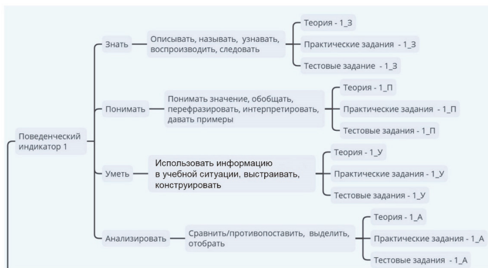
Рис. 4. Модель структуры учебных модулей для дистанционного посттренингового сопровождения (фрагмент)

Далее процесс проектирования учебных материалов выполняется с помощью спецификации тестов (табл. 1).