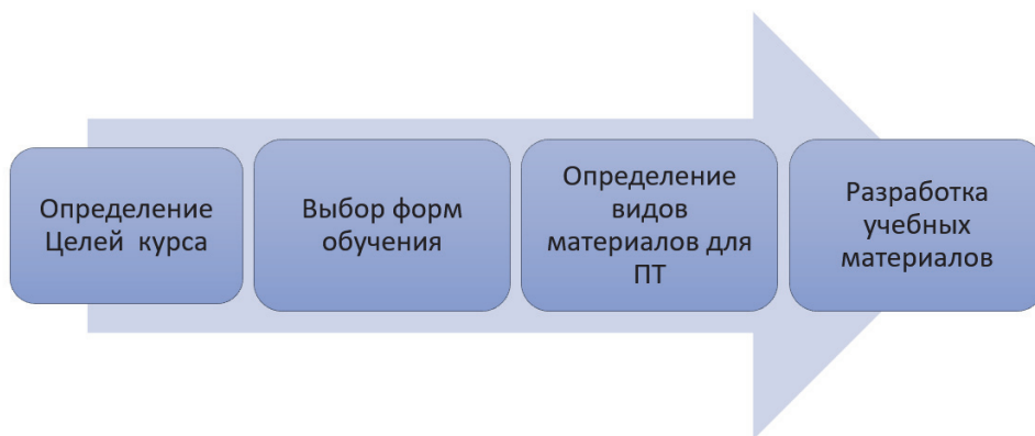
Рис. 3. Процесс разработки материалов