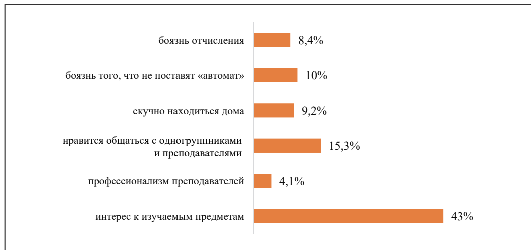
Рис. 1. Результаты анкетирования, процентное соотношение ответов на вопрос о том, что мотивирует студентов посещать занятия

с одногруппниками и преподавателями; 9,2 % скучно находиться дома; 10 % боятся того, что не поставят «автомат»; 8,4 % боятся отчисления (рис. 1).