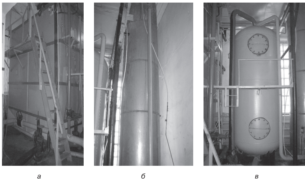
Рис. 3. Станция подготовки питьевой воды: а) осветлительный двухступенный фильтр с инертными загрузками; б) контактная колонна постозонирования воды; в) сорбционный фильтр [Station potable water a) clarification two-stage filter with inert downloads; b) contact the column of polotnyany water; c) a sorption filter]

Полученные результаты исследований процессов предподготовки воды перед подачей ее на основные сооружения позволили разработать усовершенствованную технологическую схему (схема 1) подготовки питьевой воды из маломощных водоисточников [2]. Она отличается от известных применением в ее составе префильтров с плавающей загрузкой, окислителей, коагулянтов и флокулянтов, двухступенных осветлительно-сорбционных фильтров (ОСФ) и обеззараживания ультрафиолетовым-излучением с ультразвуком и раствором гипохлорита натрия. Формирование слоя комбинированной загрузки в ОСФ осуществлялось путем введения мелкогранульного сорбента в верхний слой пенополистирола на последней стадии его промывки [7].