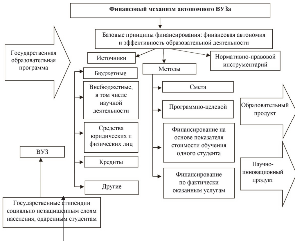
Рис. 1. Базовая модель организации финансового механизма обеспечения деятельности образовательных учреждений

новой такой модели должна быть сбалансированная система организации и обеспечения учебного процесса, фундаментальных и прикладных исследований, опытно-конструкторских работ, научно-технических и инновационных форм деятельности, способствующая объединению интересов образования, науки и производства.