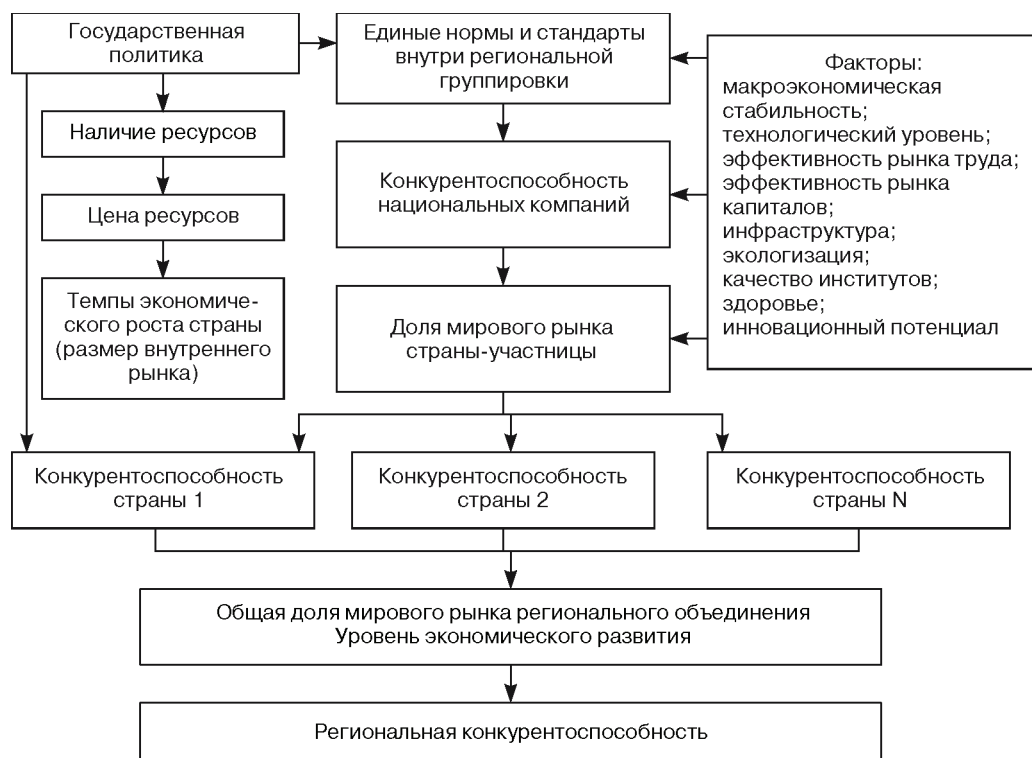
Рис. 1. Схема формирования региональной конкурентоспособности