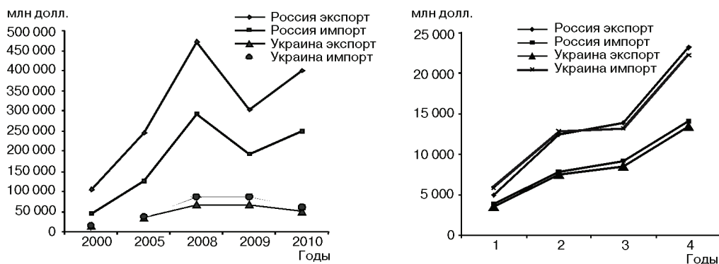
Рис. 3. Динамика внешней торговли России и Украины, из/в Россию и Украину

ния доходности многих отраслей, соотношения прибыль/риск, отсутствия относительно свободного капитала, несоординированности политических действий, уязвимости экспортной структуры, возможно и вступления этих стран в ВТО). Анализ динамики внешнеэкономических показателей представлен на рис. 3, 4.